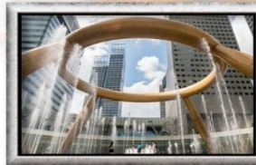
Fountain of Wealth