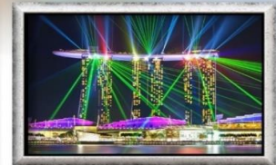
Wonder Full Light & Water Spectacular